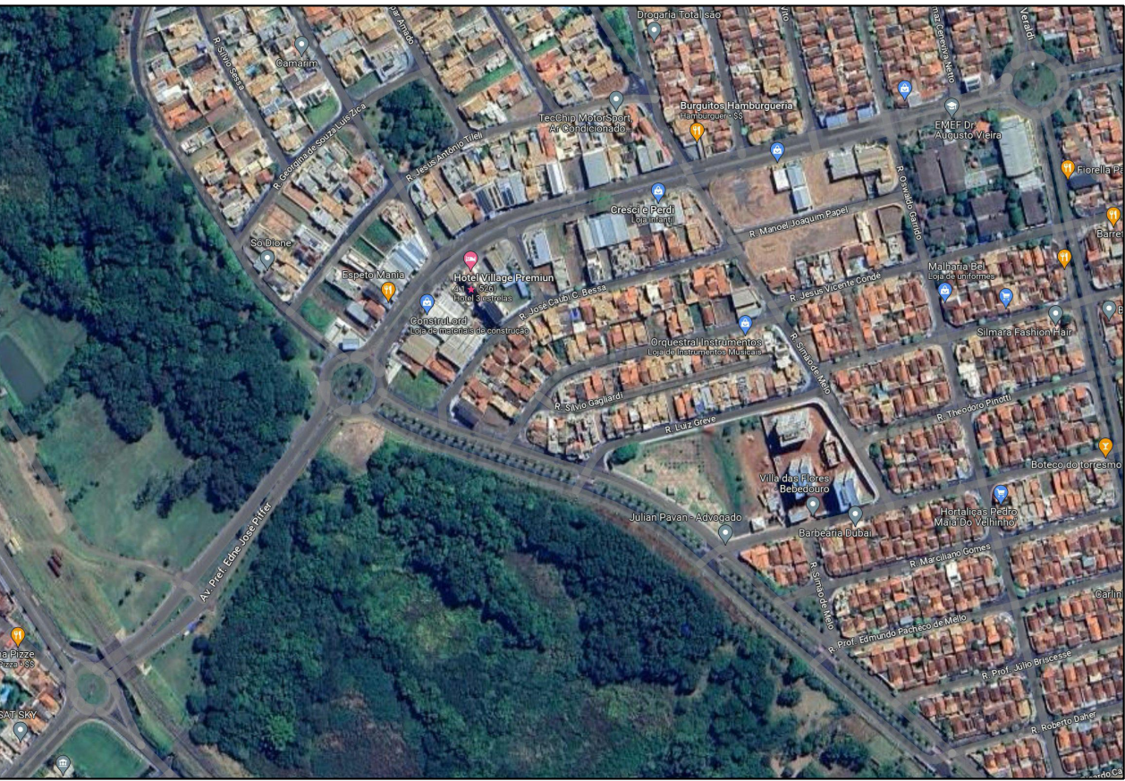
Foto Aérea da Avenida Pref. Edne José Piffer